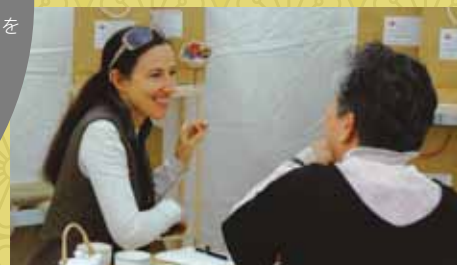
アーティスト本人と参加者の対話 「箱って?」 仙台 2008年