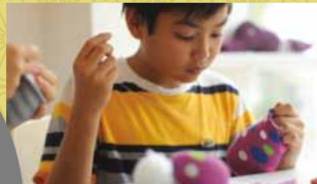
【入梅までの窓】に参加する子供 サイゴン 2010年

1983年青森県八戸市生まれ。幼少よりモダンダンスを中村美枝子に師事。上京を機に2002年より「黒沢美香&ダンサーズ」各公演に参加。2008年秋より文化庁在外研修員としてドイツ・ヘルリンに2年滞在。2011年、「未来.Co」立ち上げ。 http://mikiisojima.com/